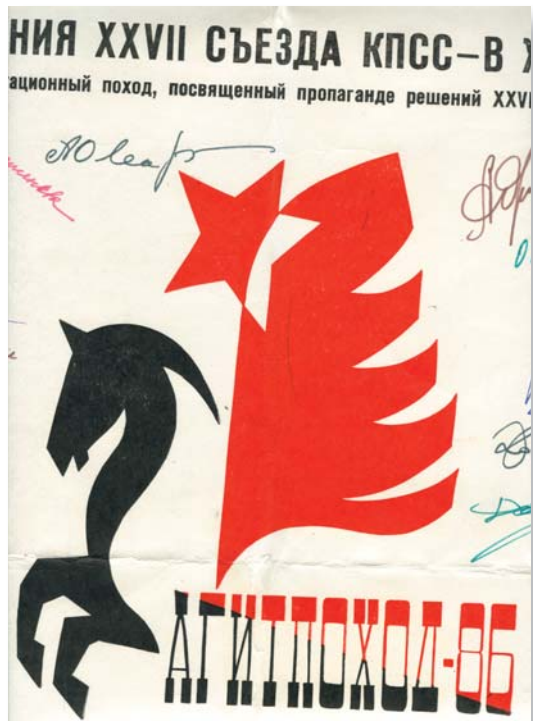
Плакат Томского обкома ВЛКСМ о проведении конно-спортивного агитпохода. 1986 г. ЦДНИ ТО. Ф.5658. Оп.1. Д.139.