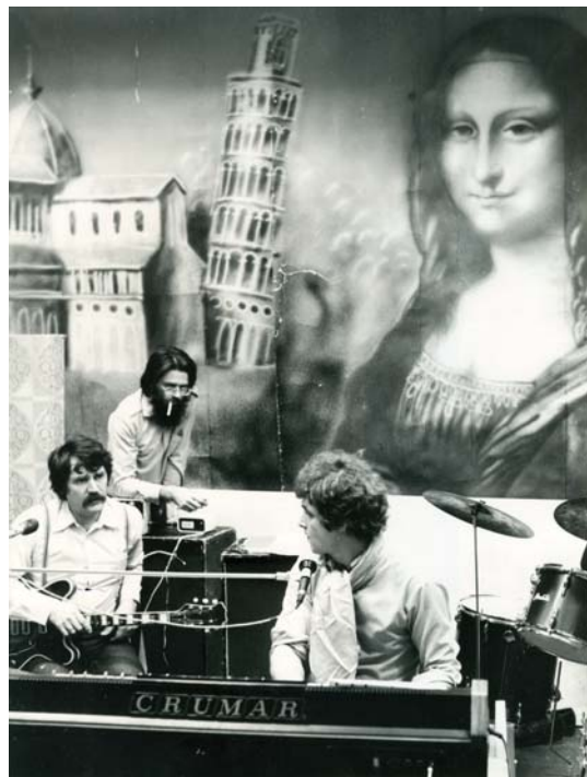
Под крылом томского комсомола развивалась молодежная музыкальная культура. ЦДНИ ТО. Ф.5658. Оп.1. Д.75.