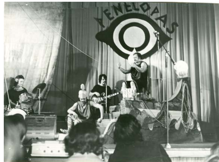
Выступает студенческий театр миниатюр «Бонифас». 1980 г. ЦДНИ ТО. Ф.5658. Оп.1. Д.75.