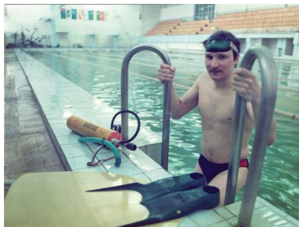
Клуб «Скат» - гордость томского комсомола. ЦДНИ ТО. Ф.5658. Оп.1. Д.75.