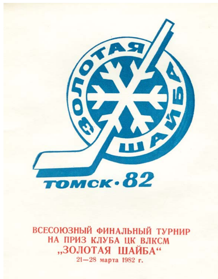
ВСЕСОЮЗНЫЙ ФИНАЛЬНЫЙ ТУРНИР НА ПРИЗ КЛУБА ЦК ВЛКСМ „ЗОЛОТАЯ ШАЙБА“ 21—28 марта 1982 г.